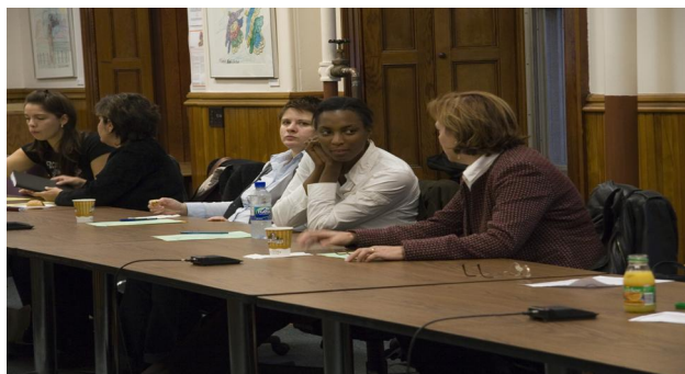
Rencontre du conseil d'administration