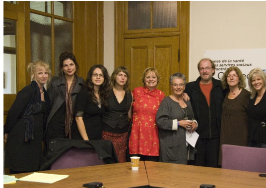
Lancement des capsules