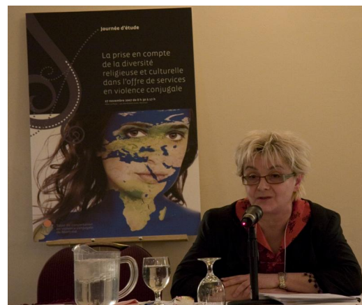
Actes de la Journée d'étude du 27 novembre 2007